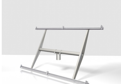
Скоба вариант 3.2