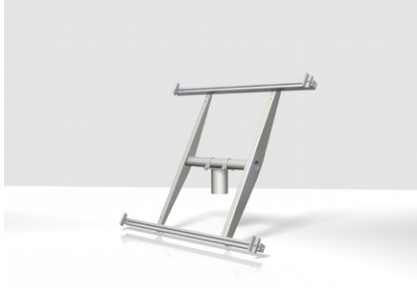
Скоба вариант 1.6